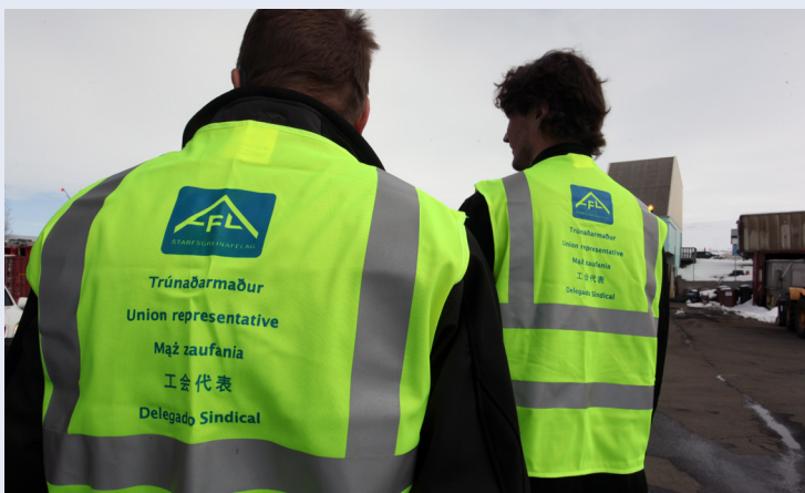
Verkfallsverðir AFLs að störfum í verkfallinu 2015.

Konur virðast frekar verða vör við brot á réttindum og líklegra virðist að brotið sé á réttindum yngra fólks en eldra, miðað við nánari sundurliðun könnunarinnar. Af einstökum atvinnugreinum bendir könnunin til þess að brotið sé á réttindum skólafulltrúa eða stuðningsfulltrúa í skólum, þjálfara, fólks í sölu- og viðgerðarþjónustu og veitinga- og gistihúsarekstri.