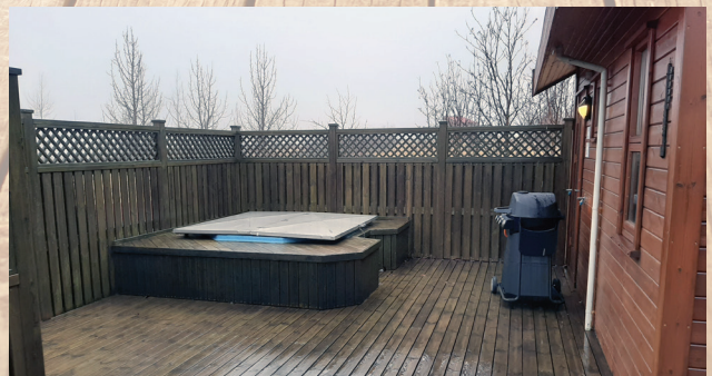
Frá nýjum orlofshúsum AFLs í Grímsnesi