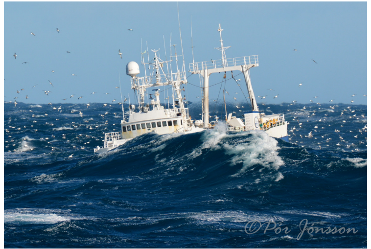
Bjartur NK121 á siglingu árið 2019.

Á það ber að líta einnig að verkföll á uppsjávarskipum utan vertíðar hafa lítil áhrif þannig að til að verkfall biti – þarf það að vera á tíma sem almennt má búast við miklum tekjum – fyrir útgerð og áhöfn. Fórnarkostnaður manna getur því verið talsverður. Verkföll á bolfiskskipum bita ekki fyrr en eftir einhvern tíma því kvótinn syndir ekki á brott.