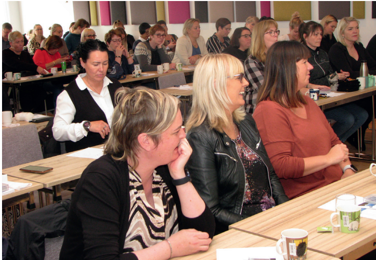
Frá starfsdegi grunnskólanna í fyrra.

Í framhaldinu hefur síðan verið sett á fót vinnutímateymi, sem á að fjalla um styttingu vinnutíma og þá mögulega með framsali kaffitíma og annarra neysluleá. Ein hugmyndin sem fram hefur komið er að vinnutímastyttingunni verði safnað saman yfir árið og hún látin ganga á móti þessum dögum þegar skólastarf liggur niðri hvort eð er.