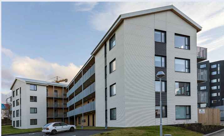
Íbúðir AFLs við Stakkholt í Reykjavík.

Félagsmenn hafa almennt brugðist vel við þessum vandkvæðum og tekið ástandinu með jafnaðargeði.