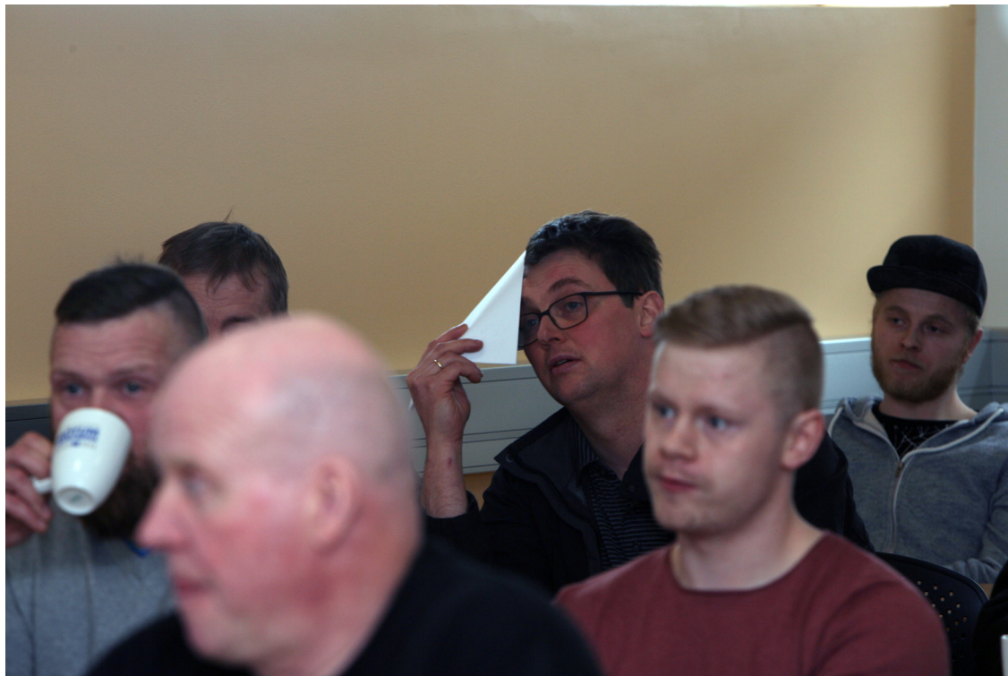
Frá kynningu á síðustu samningum innan sjómannadeildar AFLs.

Forysta Sjómannasambandsins var búin að gera sér grein fyrir þeirri neikvæðu umræðu sem var í gangi og var reynt að svara helstu atriðum sem talin voru upp sem ágallar á samningnum.