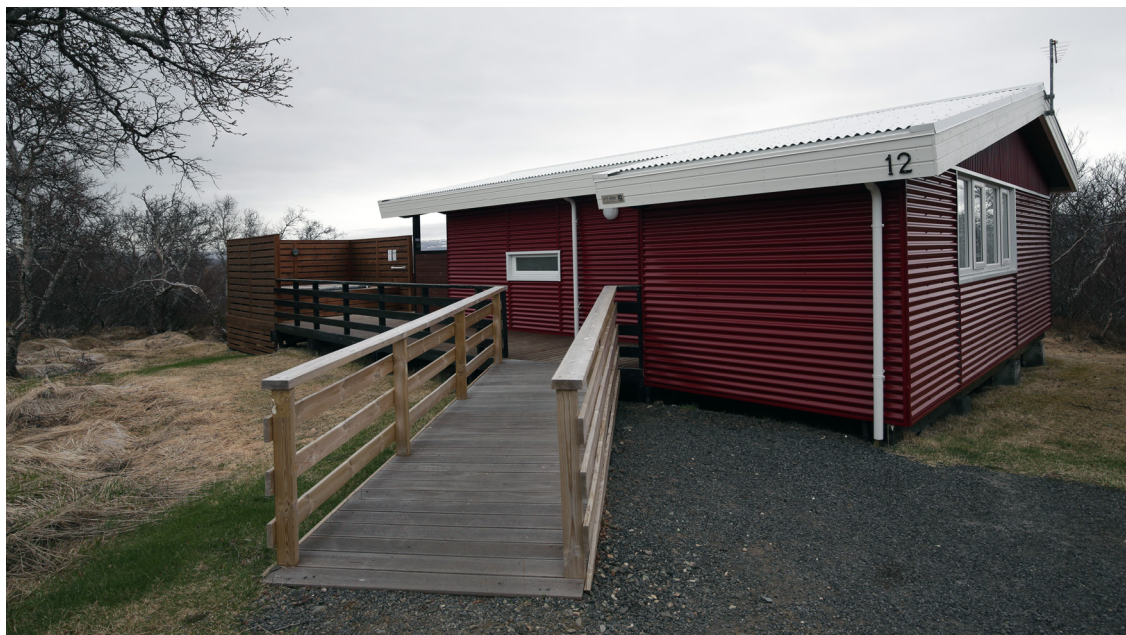
Aðgengi hefur verið bætt með skábraut og fleiru í húsi 12.

Um svipað leyti var ráðist í að klæða gafla og í mörgum tilfellum langhliðar húsanna með járni og endurnýja glugga og hurðir um leið. Við hitaveituvæðinguna þurfti að