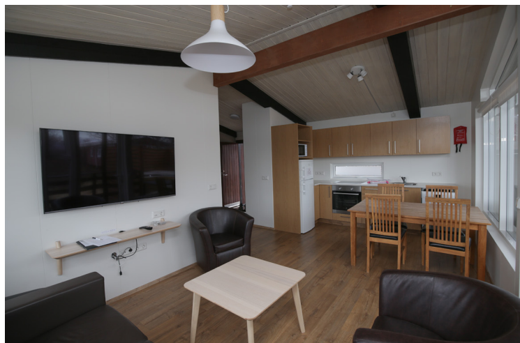
Orlofshúsin á Einarstöðum hafa fengið mikla andlitslyftingu síðustu ár.

Á síðusta ári hefur Orlofsbyggðin, sem ábyrg er fyrir viðhaldi utanhúss, ráðist í endurnýjun þaka og er það verkefni er langt komið og má því segja að fyrir utan það átak að koma hitaveitu í öll hús – hafi byggðin verið nánast endurbyggð á síðustu 10 árum.