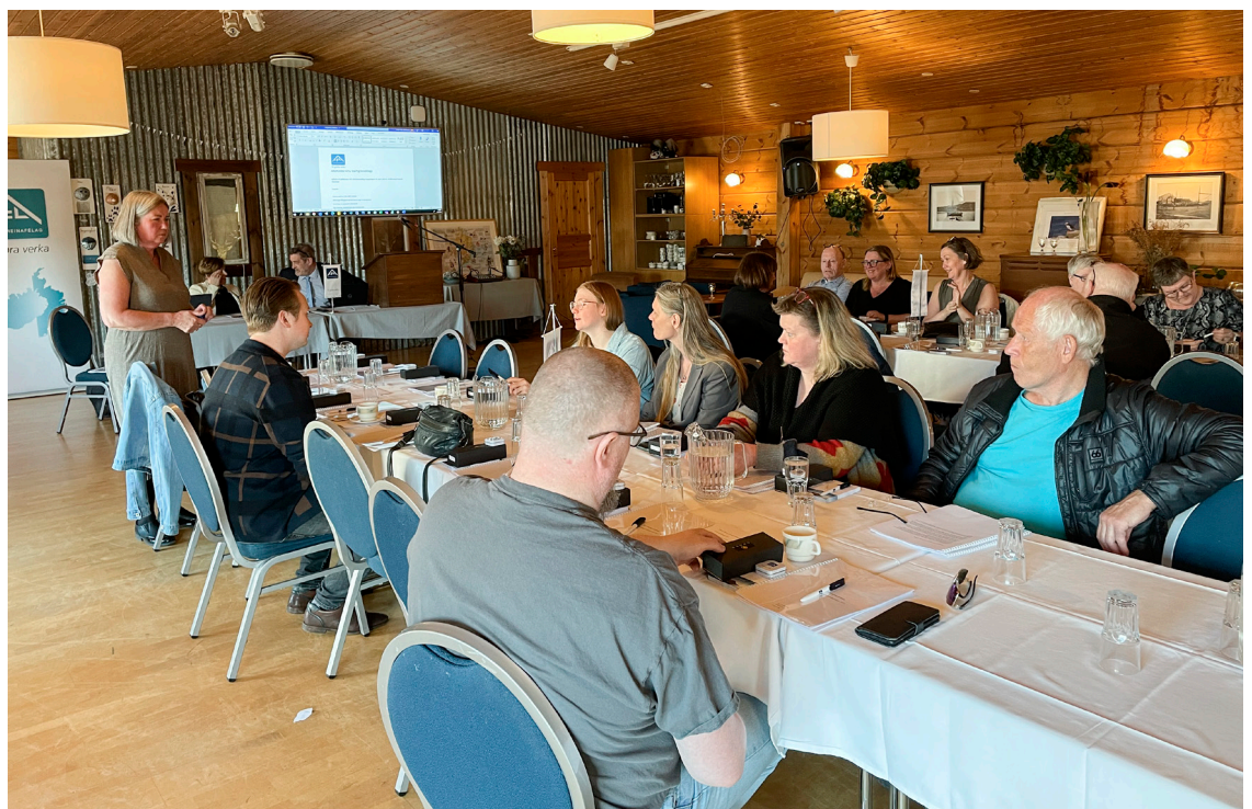
Frá aðalfundinum á Hótel Framtíð.

Þá var kosið í 30 manna trúnaðarráð félagsins og stefndi í kosningu þar – þar sem framboð í trúnaðarráð barst úr sal eftir að tillaga