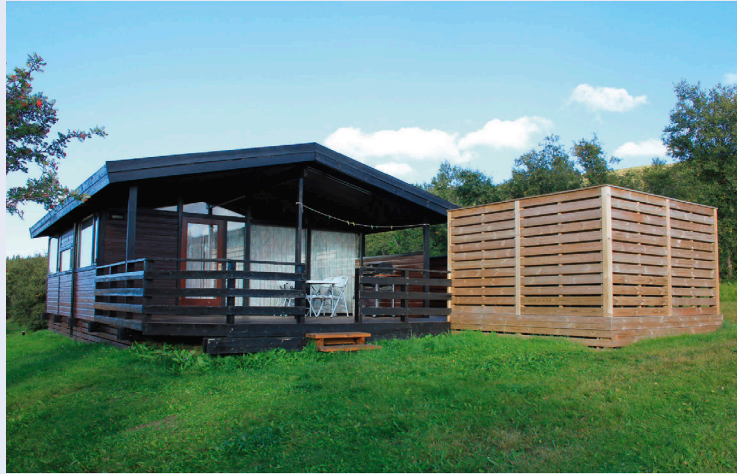
Orlofshús AFLs á Einarstöðum.

Þá hefur slæmur viðskilnaður aukist þannig að umsjónarmenn