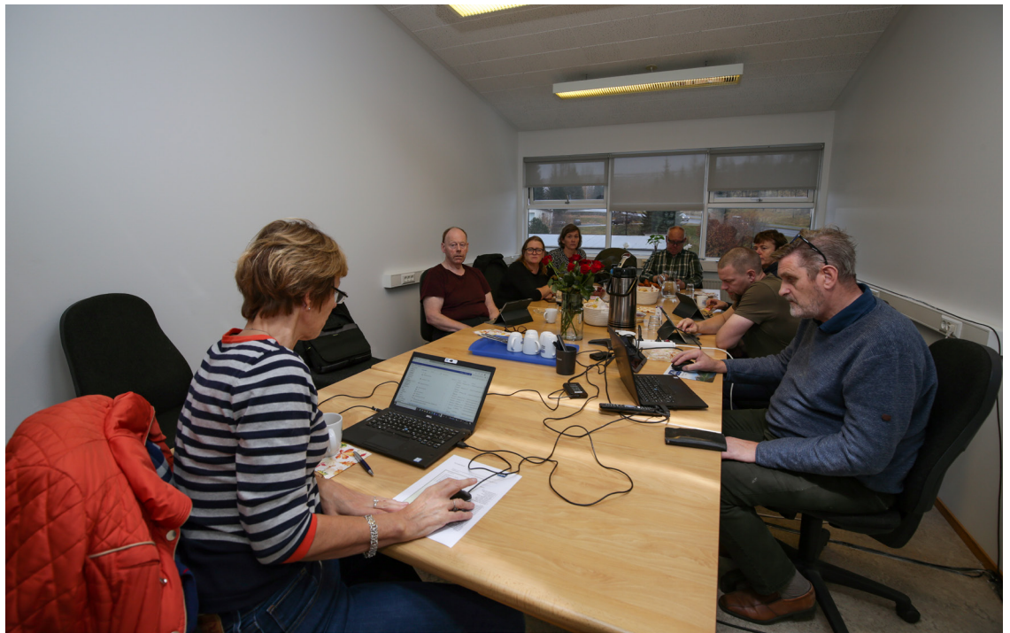
Stjórn AFLs á fundi í nóvember.

AFL Starfsgreinafélag hafnar þessum málflutningi enda var mikið fyrir því haft að ná kjarasamningum saman. Félagsmenn hafa þurft að