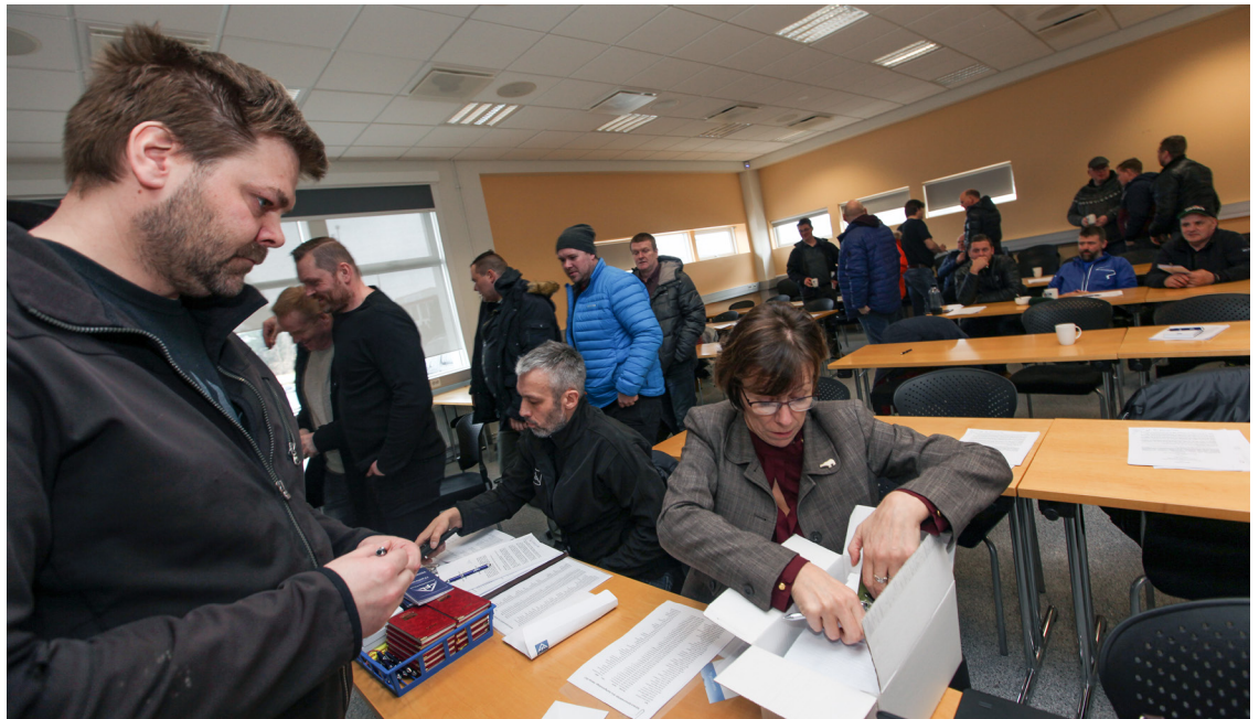
Atkvæði greidd hjá AFLi um síðasta kjarasamning sjómanna.

Sjómenn buðu 6 ára samning með þessari kröfugerð. SFS hefur alfarið hafnað kröfum sjómanna en gert gert tilboð (kröfu) um 70% skiptahlutfall, nýsmiðaákvæði verði breytt og endurnýjað og að sjómenn greiddu þriðjung af kostnaði við slysatryggingu. Að auki hafa útgerðarmenn verið með kröfu