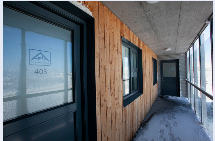
Byrjað er að úthluta orlofsíbúðum AFLs um jól og áramót.

Tilfni er til að vara félagsmenn við að leigja íbúðir í sínu nafni fyrir vini eða ættingja. AFL hefur eftirlit með notkun íbúðanna og ef félagsmáður er staðinn að því að leigja íbúð og dvelja ekki sjálfur í henni heldur ráðstafa henni til annarra – getur hann verið útlokaður frá leigu orlofskosta í framhaldinu auk þess sem félagið áskilur sér rétt til að innheimta „markaðsleigu“ fyrir íbúðina enda eru íbúðir félagsins sameign félagsmanna og einungis ætlaðar