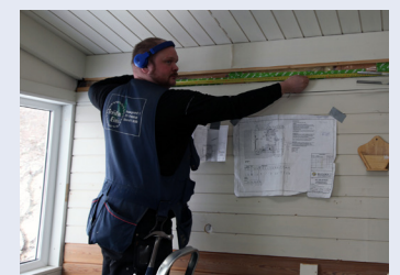
Frá framkvæmdum í orlofshúsunum á Einarstöðum.

Til stendur síðan að gera andlitslyftingu á bústöðum félagsins í Lóni og verða þá öll orlofshús félagsins í mjög ásætlanlegu ástandi eftir.